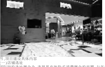
浙江奥康鞋业股份有限公司非公开发行股票预案