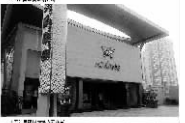
浙江奥康鞋业股份有限公司非公开发行股票预案