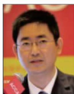
何杰 深圳证券交易所 综合研究所所长