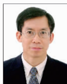
胡汝银 上海证券交易所首席经济学家 资本市场研究所所长