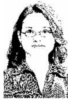
证券时报记者 杨兰