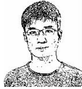
证券时报记者 颜金成