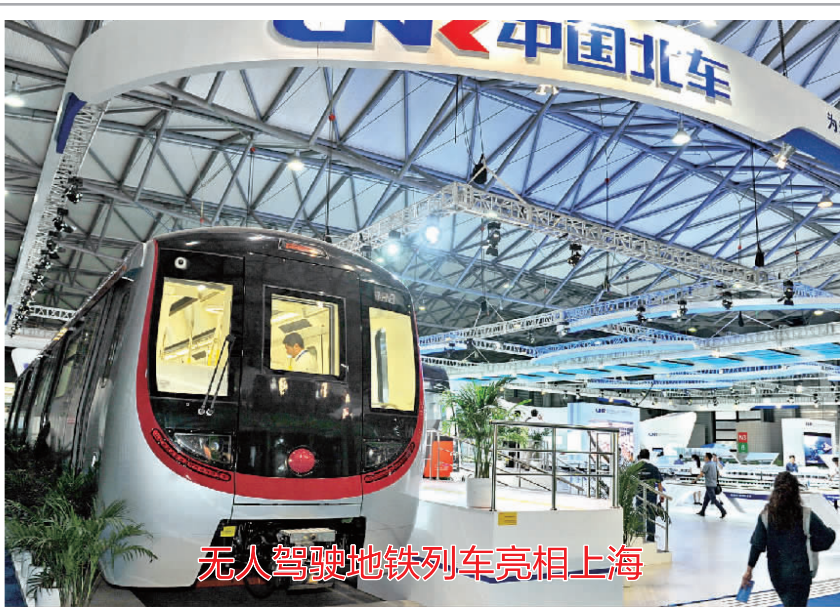
无人驾驶地铁列车亮相上海

业内人士普遍认为,创业板公司积极利用小额快速再融资来获得持续发展所需的资金,有利于降低融资成本,加快融资效率,进一步提升公司资产质量,真正发挥创业板有效支持创新性、科技型公司持续成长的关键作用。