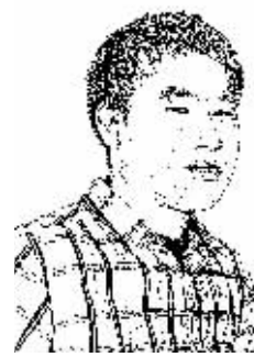
证券时报记者 尹振茂

不到关照。尽管现在已经有少数省份成立了属于自己的铁路产业投资基金,但与数额巨大的高铁投资相比,这些省级铁路产业投资基金还是明显不够。由此,各省构建一小时高铁经济圈的进程也将受到影响。