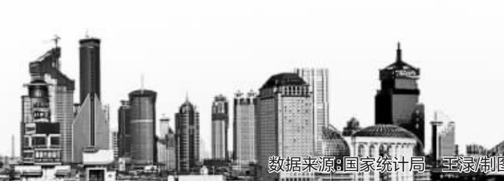
数据来源:国家统计局,王霖制图

朱光认为,近期全国范围内一些房企推盘节奏加快,打折力度加大,但市场观望情绪依旧浓厚,需求提升不明显,也导致了库存继续加大。预计今年下半年,随着市场供应的继续上升,