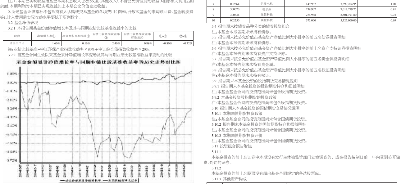
基金业绩累计净值增长率与同期业绩比较基准收益率的历史走势对比图 注:1、本基金基金合同于2014年3月7日生效,截至本报告期末本基金合同生效未满一年且仍处于建仓期。