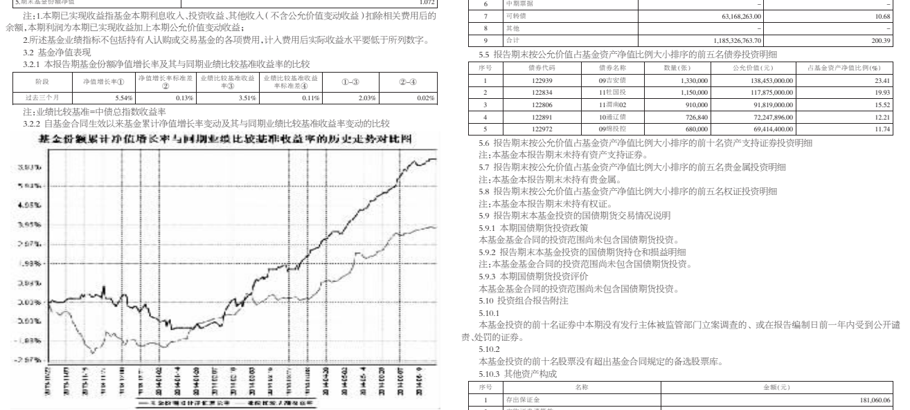
基金业绩累计净值增长率与同期业绩比较基准收益率的历史走势对比图 注:1、本基金基金合同于2013年10月22日生效,截至本报告期末本基金合同生效未满一年。