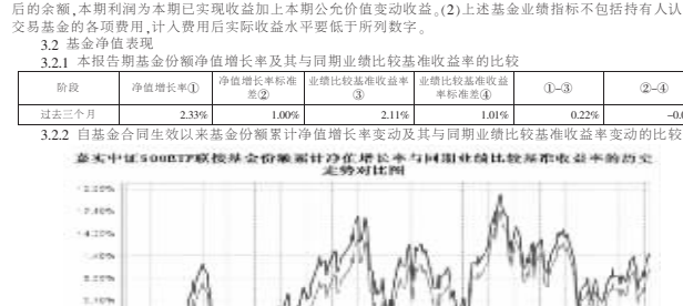
图:嘉实中证 500ETF 联接基金份额累计净值增长率与同期业绩比较基准收益率的历史走势对比图 (2013年2月6日至2014年6月30日)

3.2.2 本基金合同生效以来基金资产净值增长率变动及其与同期业绩比较基准收益率变动的比较