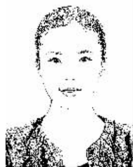
证券时报记者 程丹

继证券业、基金业创新大会之后，首届期货创新大会今日召开，这无疑给站在十字路口茫然四顾的期货业带来了新期待。