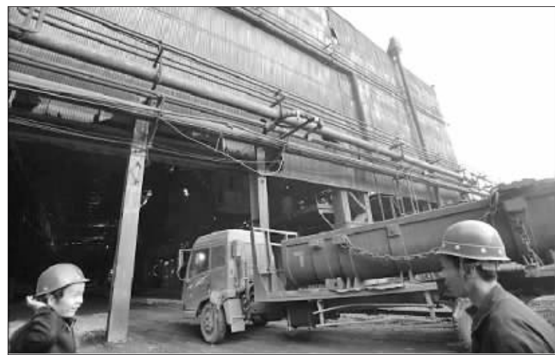
两名工人站在马钢合肥公司一座老旧的车间前

据悉,本次合肥公司开工建设的连续镀锌线项目计划投资13亿元,新建1条热镀锌-镀铝硅生产线、1条半自动化包装线及其配套设施。产品主要定位在高档家电用镀锌板、汽车用高强镀锌铝硅板,设计规模为32万吨/