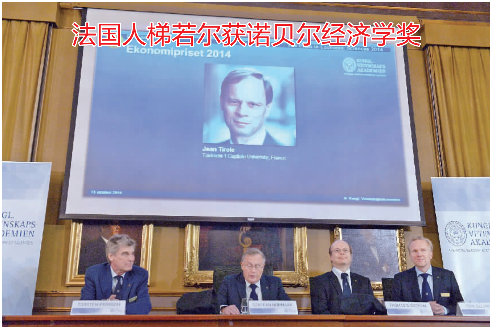
瑞典皇家科学院昨日宣布,将2014年诺贝尔经济学奖授予法国经济学家让·梯若尔,以表彰他对市场力量与调控领域研究的贡献。多年来,诺贝尔经济学奖都会出现“美国身影”,但今年的诺贝尔经济学奖获得者却由法国经济学家独得。图为瑞典皇家科学院常务秘书诺尔马克(左二)宣布2014年诺贝尔经济学奖得主。(更多报道见A4版)