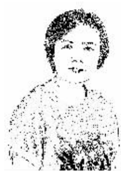
证券时报记者 潘玉蓉