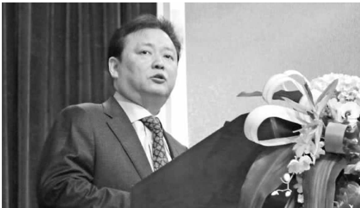
西南证券董事长崔坚在论坛上发言

不论是基于行业整合的产业并购,还是业务转型的跨界并购,都要小心并购后的“消化不良”。崔坚说,并购行为发生后,相关企业股价短期内会上涨,但并购者与被并购者业务真正融合、协同,转入良性运作和循环,并非易事。面对这一轮文化传媒行业的并购浪潮,崔坚对市场参与企业的建议是,既不盲目也不保守是应遵循的原则,必须找到合适团队,合适机会和合适标的。崔坚表示,唯有理性并购才有利于不同企业之间内容、渠道、平台的融合,才能真正促进电影、电视剧、动漫、游戏、文学等各种不同内容形态的交叉渗透,完善产业链布局,也是国内企业做大做强,形成国际性文化传媒巨头的必由之路。中国的影视企业也只有通过不断的内部整合,大幅提高行业集中度,才能诞生世界级的综合传媒集团。