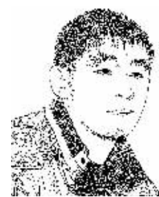
证券时报记者 贾壮

现代财政制度是国家治理的基石,十八届三中全会决定中明确提出,必须完善立法、明确事权、改革税制、稳定税负、透明预算、提高效率,建立现代财政制度,发挥中央和地方两个积极性。”三中全会之后,财税领域改革措施紧锣密鼓,但所有改革都绕不开一个棘手的问题:数量庞大的地方政府性存量债如何妥善处理。