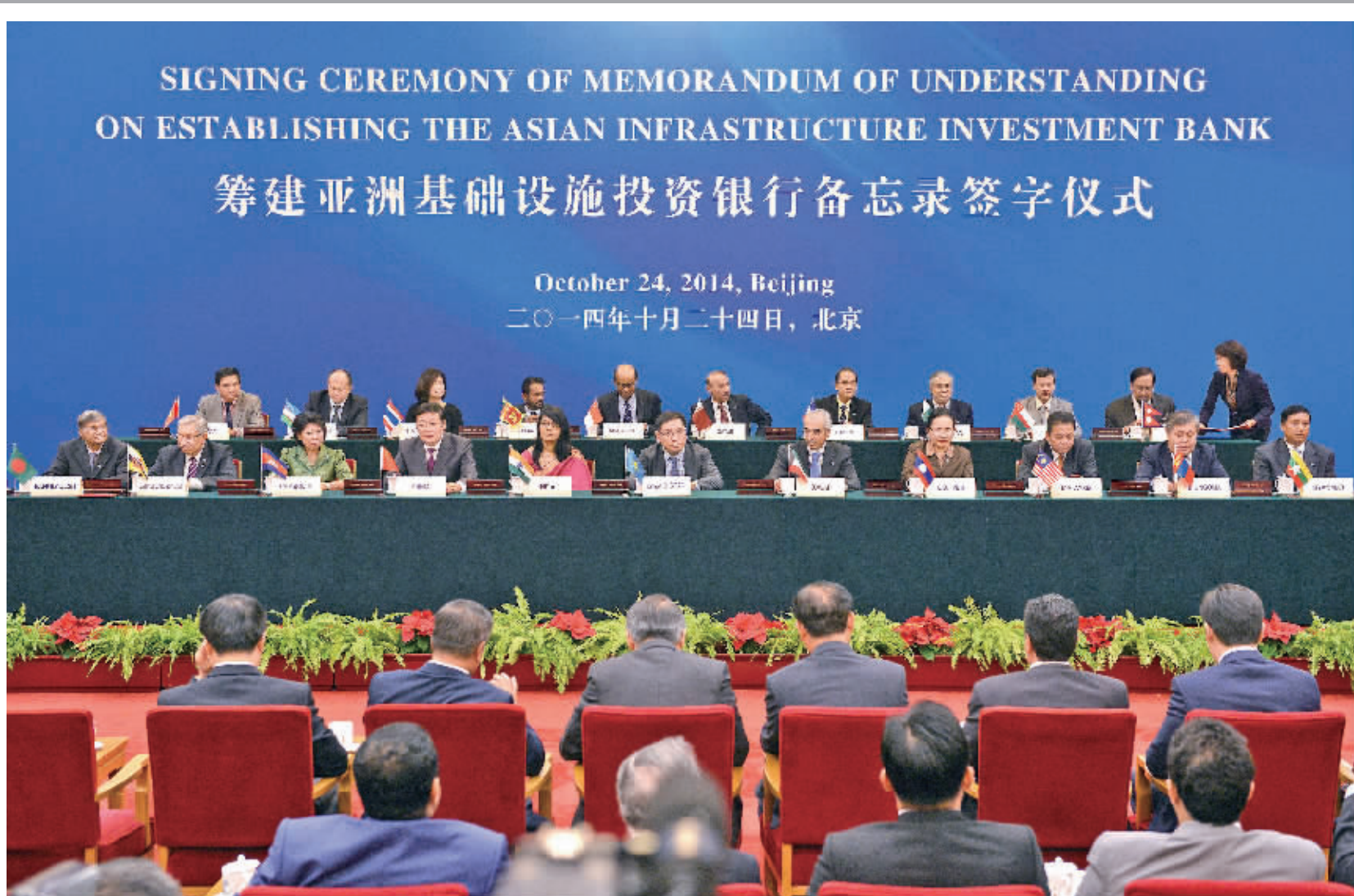
21国在京签约决定成立亚洲基础设施投资银行

五是要着力提升依法治市的能力和素质。全系统各级领导干部和广大职工要系统掌握法律赋予的职责权力,法律规定的权利义务,为依法治市提供坚实的基础。要锻炼提高依法办事的能力,补充法律专门人才,依托现有的公职律师队伍,建立以法制机构人员为主体、吸收专家和律师参加的法律顾问队伍,保证法律顾问在制定重大行政决策、推进依法行政中发挥积极作用,不断提高全系统依法治市的水平。