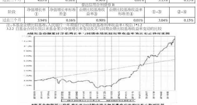
泰达宏利信用合利定期开放债券型证券投资基金 2014年7月1日至2014年9月30日 基金净值走势图