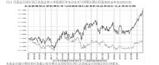
泰达宏利逆向策略股票型证券投资基金 2014年7月1日至2014年9月30日 基金净值走势图