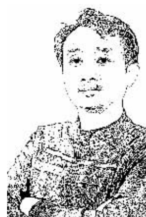
证券时报记者 黄小鹏

抢国际市场有重要关系。在国际市场大合同中,中国公司是笑傲江湖还是任人宰割,除了公司层面的实力和谈判技巧之外,主要还是取决于双方的市场结构。正反两方面例子是现成的。正的例子是,中国铁道部当初引进外国高铁技术时,凭借其独家需求者的地位游刃于多家外国公司之间,纵横捭阖,各个击破,轻易获得了有利的合作条件,也成就了中国高铁跨越式发展的大业;反的例子是铁矿石进口谈判,中国作为最大的需求方,却以一群散兵游勇参与博弈,面对的是淡水河谷、力拓和必和必拓三家供应巨头,所以年年谈判都败得一塌糊涂。