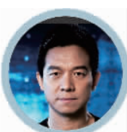
乐视网董事长: 贾跃亭

创业板五周岁了,乐视网上市也四年了。乐视网的成长有目共睹,已经成为行业领军企业之一,也见证了创业板的成长和成熟。目前乐视网正在全球拓展,沿着北洛硅(北京、洛杉矶、硅谷)快速进行全球产业布局,洛杉矶和硅谷的子公司已经成立,并先期投入2亿美元进军美国市场。我相信,垂直整合的“平台+内容+终端+应用”乐视生态全球化,未来将带给投资者更多的惊喜和回报。