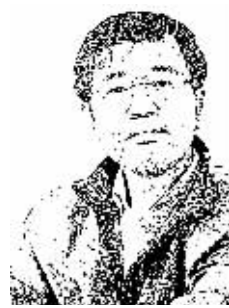
证券时报记者 肖国元

最近一周,随着央行降息政策出台,沪深股市摆脱了前期的踟躇步履,走出向上的突破行情。随着行情热络,舆论开始升温,“实房炒股”、“超级牛市”、“历史性机遇”等调子陆续有来,甚至有人喊出了“黄金十年”的口号。