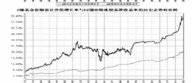
注:1.本基金于2008年10月20日起按照收取销售服务费方式收取管理费,其对应的基金份额为“宝盈增强收益债券C”. 2.按基金合同约定,本基金自基金合同生效之日起每6个月为建仓期,建仓期间本基金的各项资产配置比例符合基金合同的相关规定.