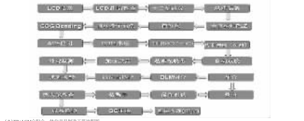
(7)FTM模组一体化生产流程图