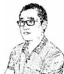
证券时报记者 朱凯

当前资本市场最热门的两件事，一个是股市，一个是资金。不过，凡事都有临界点，如果过多的资金涌入股市，带动股价连续上涨，在可能产生非理性泡沫的同时，也会干扰宽松货币政策支持实体经济的初衷实现。