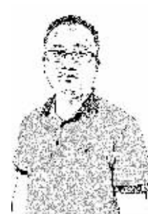
证券时报记者 罗克关

到具体方案的心情和愿望虽可理解,但并不现实。特别是,如果只将混改作为二级市场行业轮动的理由去看,那么我们对行业的理解可能会错误更多。