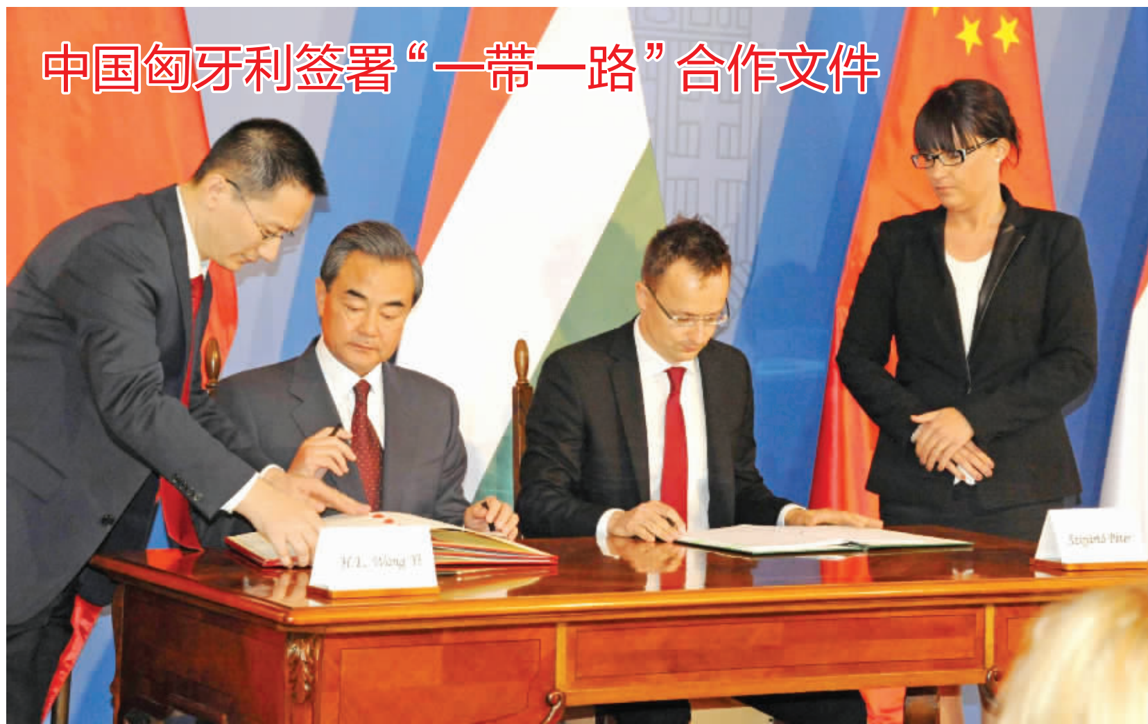
当地时间6月6日,正在匈牙利进行正式访问的中国外交部长王毅在布达佩斯同匈牙利外交与对外经济部部长西雅尔托签署了《中华人民共和国政府和匈牙利政府关于共同推进丝绸之路经济带和21世纪海上丝绸之路建设的谅解备忘录》,这是中国同欧洲国家签署的第一个此类合作文件。图为签字仪式现场。