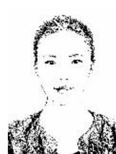
证券时报记者 程丹

一边是A股动辄上百倍的市盈率,一边是自己在海外“水土不服”市值被严重低估,看着同行业“别人家的股票”在中国资本市场上连续涨停,早就想“回家”的中概股有些坐不住了。近日,曾被称作“中国传媒第一股”的分众传媒宣布,作价457亿元人民币借壳宏达新材上市,市场将迎来首只真正意义上回归A股的中概股。