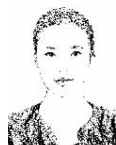
证券时报记者 程丹

令人失望。 经济低迷时期，逆周期调节政策不可或缺。早则资身，水则资车，在经济上行时应“及时刹车”避免经济过热催生泡沫，在经济下行时需“强力助推”阻止经济衰退而陷入萧条。2008年全球金融危机时，逆周期调节在消除系统风险方面发挥了关键作用。美联储的多轮量化宽松政策、欧元区的长期再融资计划虽有争议，但确实帮助一些经济体摆脱了经济衰退。 除了运用财政、货币、投资与产业政策等逆周期调节手段外，在金融市场领域，逆周期还可以通过行政干预、调整业务监管、转变调控方向等方式发挥作用。1963年的日本救市、1987年美联储救市以及1998年的香港“金融保卫战”，均带有逆周期调节的鲜明特征。前期，中国A股市场非理性下跌，多个部门出台措施联合维稳，也可以归入逆周期调节的范畴。 当前，全球经济一体化趋势进一步加强，金融市场融合不可逆转，你中有我，我中有你”的开放格局加大了各个经济体金融市场的联动，各个经济体有必要密切关注金融市场变化，适时出台一些措施来避免系统性风险的发生。