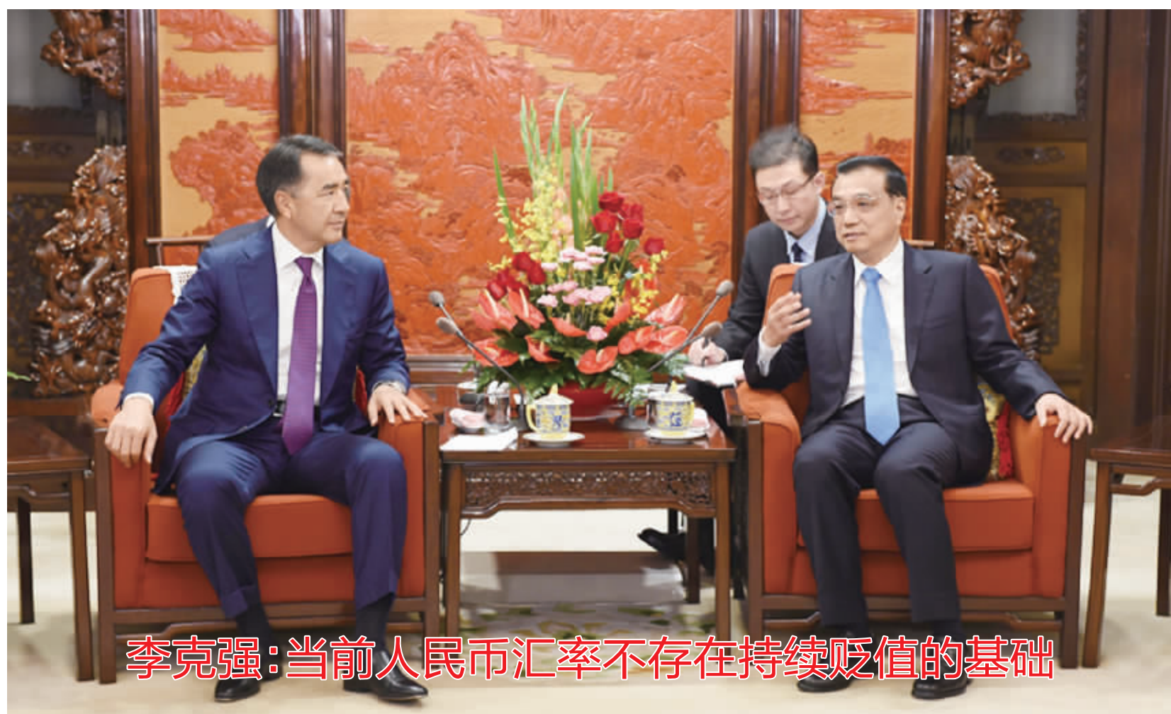
李克强：当前人民币汇率不存在持续贬值的基础

中金公司研报认为，今年M2增速至少应达到13%，才能为放缓的经济增长提供足够的支撑。在经济迎来较持续的复苏之前，货币政策仍需维持宽松态势，除去此次降准外，年内至少还应再降100个基点。（更多报道见A2版）