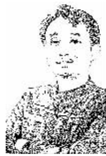
证券时报记者 黄小鹏

济与股市之间连“人与狗”的关系都不存在，它更像是经历了一次梦游。在前半段的牛市，中国经济被描绘成这样一幅图景：虽然短期有下滑但货币闸门已经开启，经济“很快就好”，在“改革”助力下大国崛起、赶超英美“指日可待”。主流的市场机构和一些媒体编故事、讲逻辑，争相晒乐观、玩煽情。6月中旬市场突然大跌后，经济又被描绘成完全相反的图景：不但短期不好而且长期也有隐忧，货币宽松因“二师兄”而有变，人民币要贬值，甚至“改革牛”也没有了。市场上又展开了悲观竞赛。