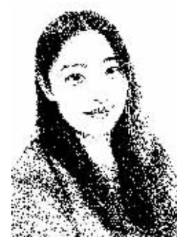
证券时报记者 孙璐璐

次性贬值近5%，继而连锁引发全球股市、大宗商品、汇市等出现剧烈震荡。耶伦也承认，7月议息会议以来的主要事态发展包括股市价格下跌、美元进一步升值、风险利差的扩大等，已导致整体的金融状况在一定程度上趋紧。鉴于美国和世界其他国家及地区存在显著的经济和金融关联性，海外局势必须予以密切关注。美联储做出是否加息的决定，需综合包括劳动力市场状况、通胀压力、预期经济增速和国际形势发展等在内的一系列经济和金融指标。虽然耶伦仍表示年底前加息是合适的，但从其偏鸽派的表态来看，由于目前美国通胀率仍低于美联储目标，加息的国内硬条件未满足，加之近期全球新兴市场的剧烈动荡会对美国经济形成不利的溢出影响，选择此时暂缓加息也是情理之中。