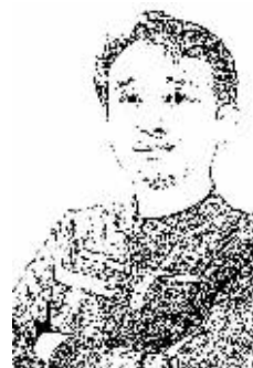
证券时报记者 黄小鹏

第七次中英经济财金对话政策成果昨日公布，中英双方支持上海证券交易所和伦敦证券交易所就互联互通问题开展可行性研究。通俗地讲，就是研究“沪伦通”。