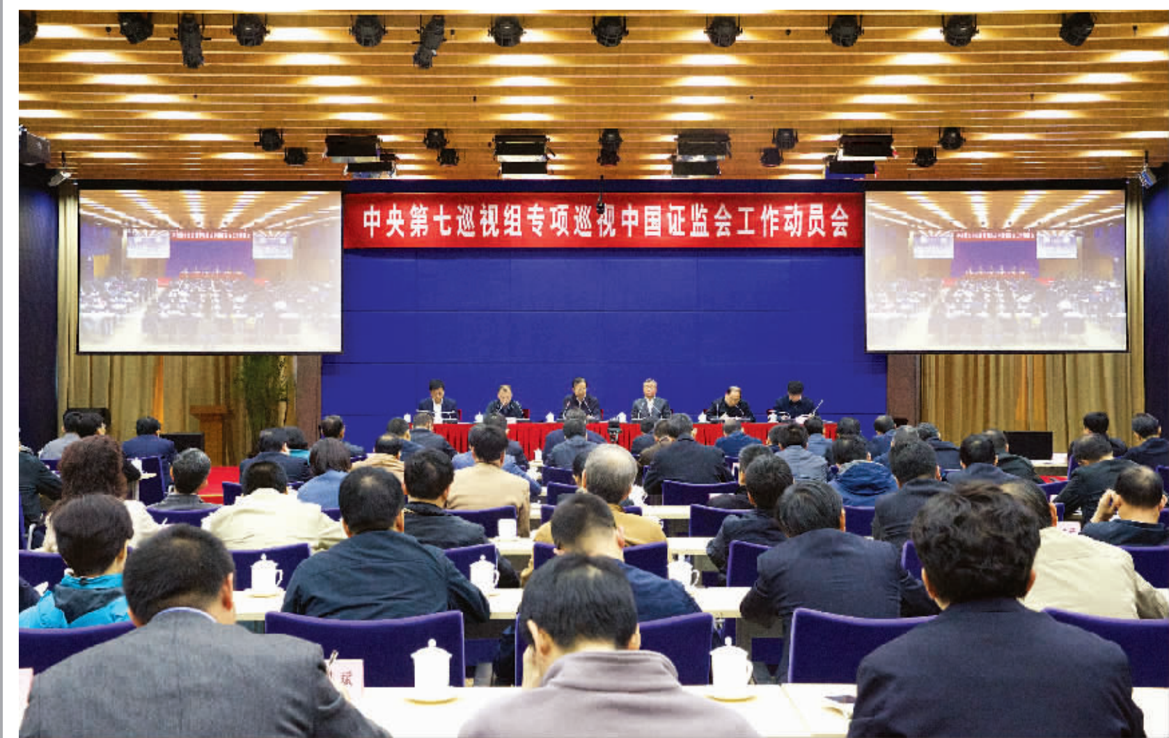
中央第七巡视组专项巡视中国证监会工作动员会召开