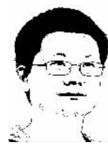
证券时报记者 余胜良

证金公司入市的目的已经达到。尽管媒体大都采用“近六成公司净利润增长”之类的说法,但如果换一种说法,就是超过四成的上市公司业绩是下降的。