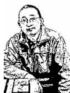
证券时报记者 徐涛

依了惯常的经验,IPO于中国股市以及身在其中的投资者而言,形象可爱的日子似乎实在是屈指可数。这就难怪,上周五证监会突然宣布重启IPO之后,许多人马上就开始了周一的股市能否经受住“重锤”敲打;有忧心忡忡者甚至认为,这是悬在市场上的巨大利空。