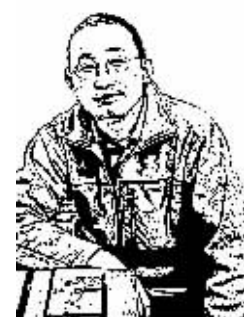
证券时报记者 徐涛

可连他和那些同为泛亚撑腰、打过气的什么大人物一起告,根本无需采取“围攻”之类的非法手段。