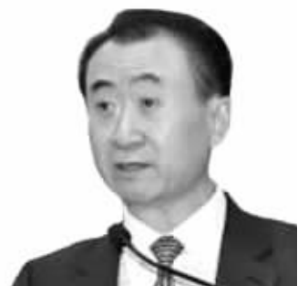
官兵/制图

大连万达集团董事长王健林表示,西方早于20年前就有人表示中国楼市会崩溃,但至今仍未兑现,因此他不相信未来中国房地产市场会出现崩溃。