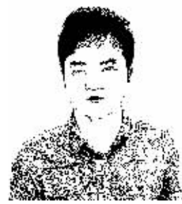
证券时报记者 陈文斌

证监会日前核准了7家企业的首发申请，这7家企业是首批适用新规发行的新股，高澜股份今日率先开启新股申购。