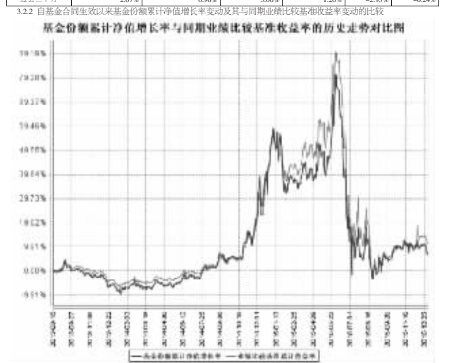
注:按基金合同约定,本基金基金合同生效前6个月为建仓期,建仓期结束时本基金的各项投资比例已达到基金合同约定的... 基金业绩比较基准:中证转债指数收益率x95%+银行活期存款利率(税后)x5%