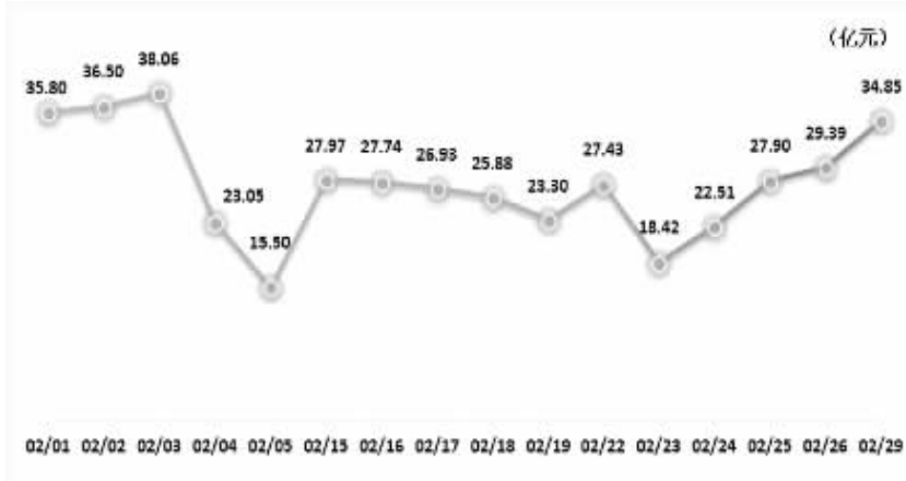
2月沪股通活跃股成交金额排行