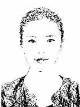
证券时报记者 程丹

“不死鸟”神话终破灭 垃圾股炒作亮红灯 ■ 时眼观察 | In Our Eyes |