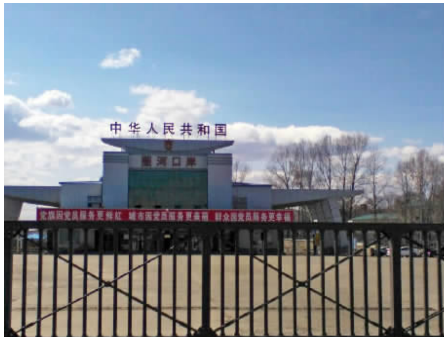
仍在正常通关的珲春市圈河口岸