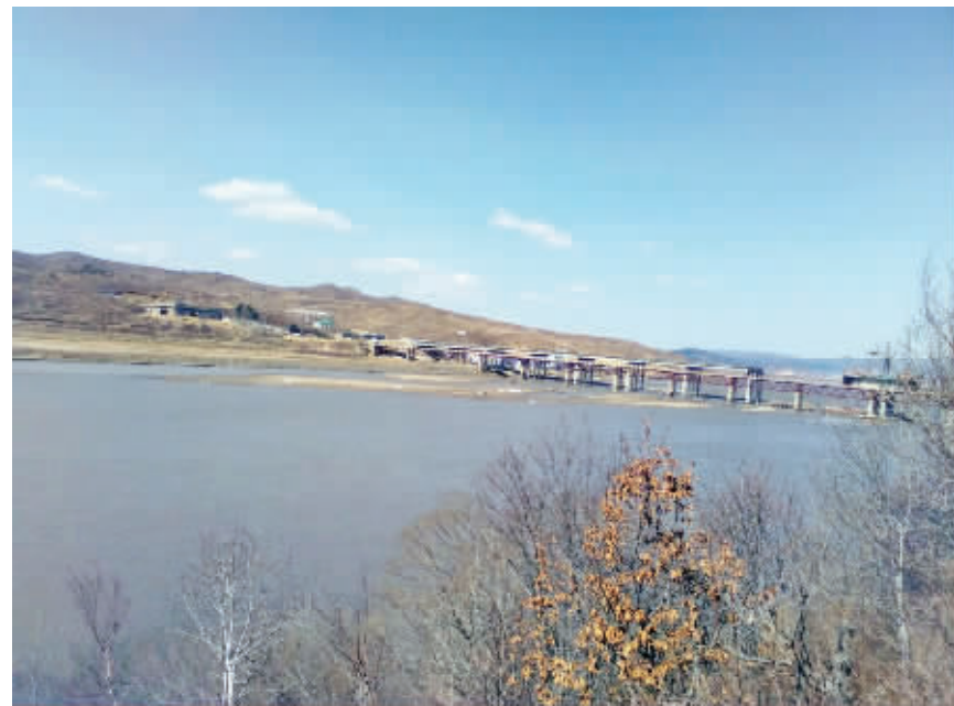
图们江的对岸就是朝鲜