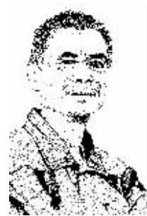
证券时报记者 吴智钢