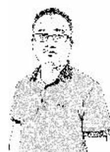
证券时报记者 罗克关

过去一周，人民币汇率震荡下行，在岸对美元中间价6月28日走出了近6年来的新低6.6528，离岸即期价格则因消息面的误导在6月30日盘中一度击穿6.7。自去年8·11汇改以来，此情此景只有美联储宣布加息前后的市场状况能够与之相提并论。