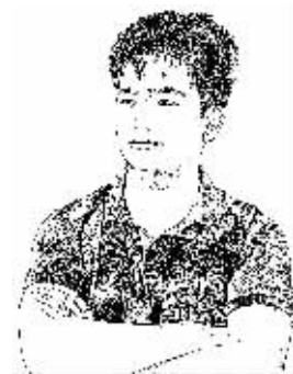
证券时报记者 李雪峰