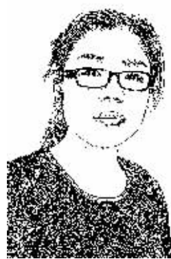
证券时报记者 许岩

6.9%！外界最为关注的上半年我国经济增长最终定格。成绩让人眼前一亮，又一次见证了中国经济稳中向好态势。