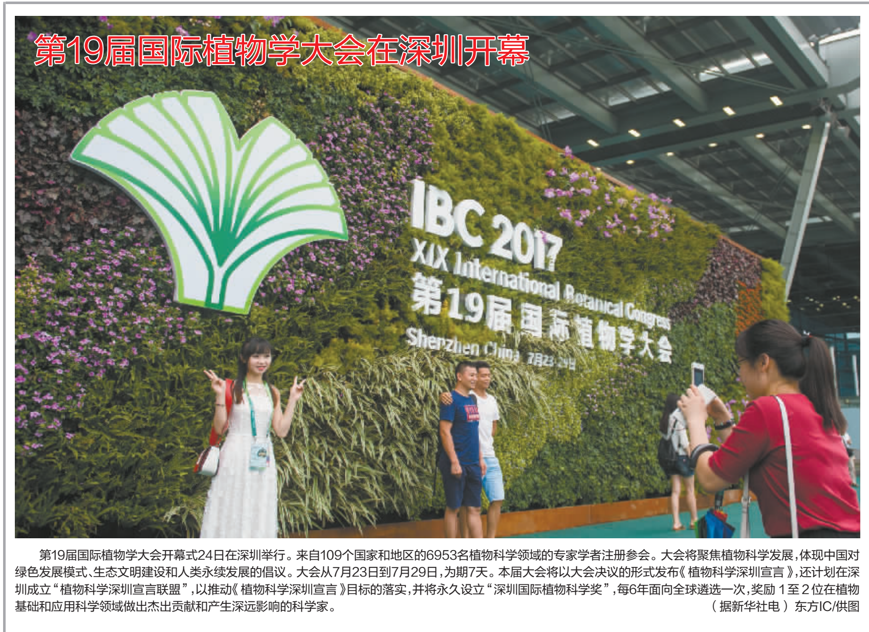
第19届国际植物学大会在深圳开幕

第19届国际植物学大会开幕式24日在深圳举行。来自109个国家和地区的6953名植物科学领域的专家学者注册参会。大会将聚焦植物科学发展,体现中国对绿色发展模式、生态文明建设和人类永续发展的倡议。大会从7月23日到7月29日,为期7天。本届大会将以大会决议的形式发布《植物科学深圳宣言》,还计划在深圳成立“植物科学深圳宣言联盟”,以推动《植物科学深圳宣言》目标的落实,并将永久设立“深圳国际植物科学奖”,每6年面向全球遴选一次,奖励1至2位在植物基础和科学领域做出杰出贡献和产生深远影响的科学家。 (据新华社电)