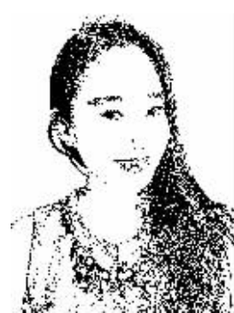
证券时报记者 易永英

今年以来,保监会积极推进保险费率形成机制改革和保险产品监管改革,正式实施偿二代监管制度体系等,这一系列动作都意在坚持引导保险行业回归保障本源。“回归保障”成为行业的主旋律,而这不仅是监管的要求,也是保险行业自身的内在需要。 首先,保险的核心价值在于提供风险保障。风险保障功能是保险业的立业之本,是其他行业不可替代的行业价值灵魂所在。保险发展的两驾马车,一是投资功能,另一个就是保障功能。而从近几年的市场来看,部分公司过于关注保险的投资功能,忽略了保障根本的保障功能。这种舍本逐末的方式不健康也不会长久。险企要真正做到“两条腿走路”,实现快速平稳发展,就需要补齐短板,加强保障主业。 其次,自2008年全球金融危机以来,各国相继进入低利率时代,想要更好地应对利率风险,追求稳定的利润,险企尤其是寿险公司最重要的就是要提升产品保障占比。在低利率环境下,销售长期储蓄型产品会承担较大的利率风险,而从目前的趋势来看,全球范围内的利率水平仍将维持在较低位置,减少对利差的依赖程度,是险企尤其是寿险公司应对复杂利率环境的根本途径。在可见的预期投资收益率下