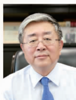
国元证券董事长 蔡咏