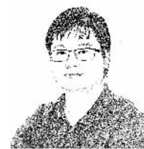
证券时报记者 余胜良

信息披露是一个很讲究的学问,有人想引起注意却没人关注,有人随便引用一个数字却能引来轩然大波,比如常山药业公告其伟哥仿制药获批时,称中国阳痿(ED)患者人数约1.4亿人。