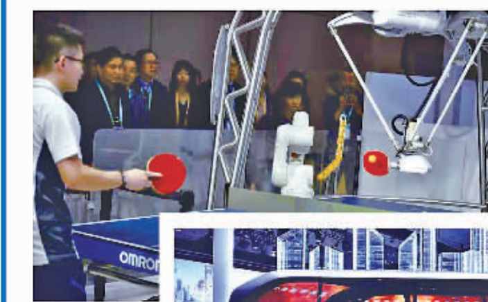
和机器人打乒乓球是怎样一种体验?