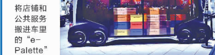
将店铺和公共服务搬进车里的“e-Palette”