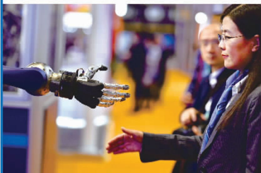
「你好,人类」「你好,机器人」