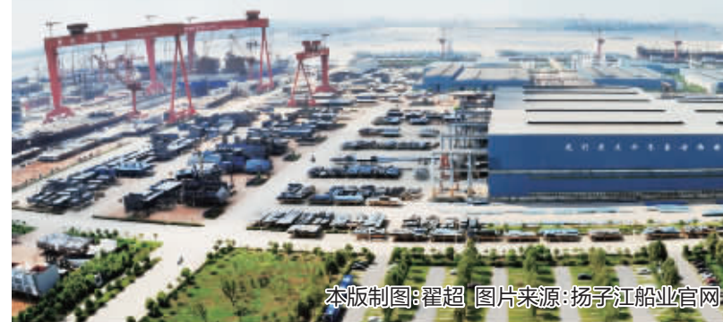
本版制图:翟超