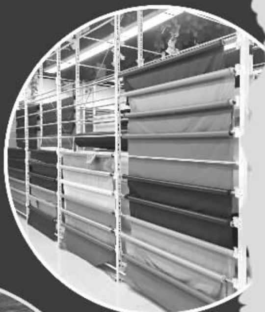
中国东方丝绸市场内,“紫晶花”布料颜色丰富

印度、东南亚疫情导致部分订单转移到中国并非国内纺织业迎来短期火热行情的主要因素,今年偏长的国庆假期导致的终端需求拉动,以及冬季前的传统补库存旺季都有一定影响。