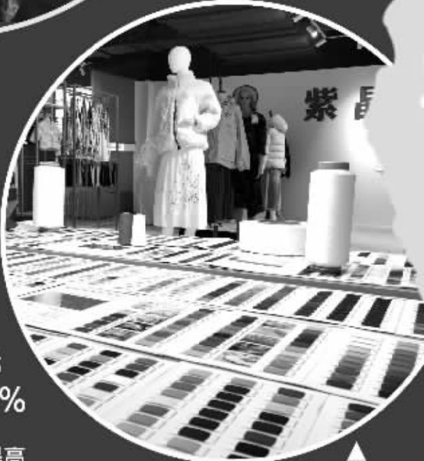
“紫晶花”布料超市上月接到100万米的外贸大单