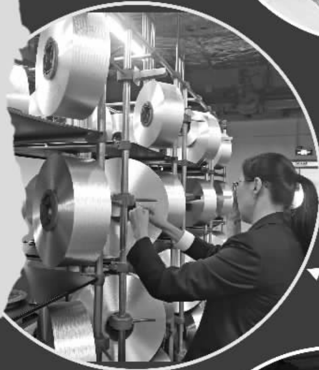
东方盛虹正在加班加点忙生产