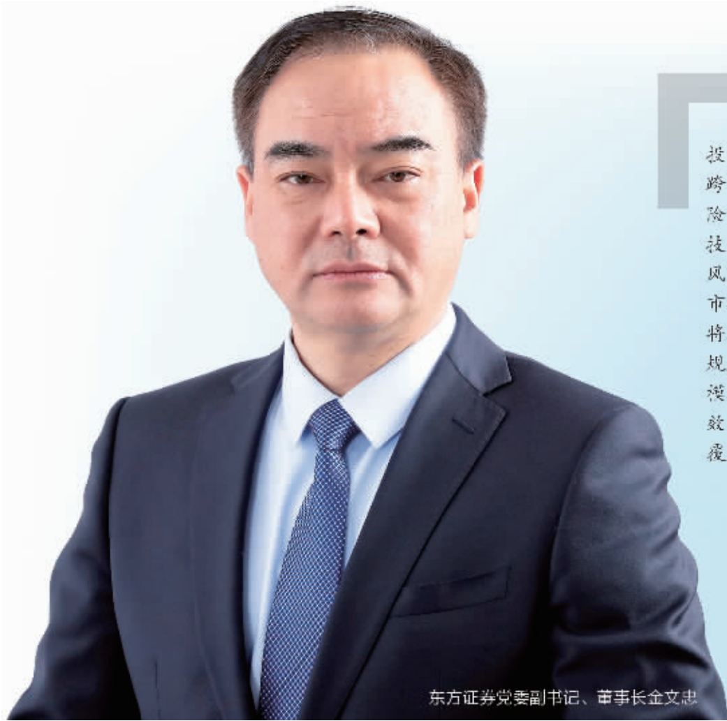
东方证券党委副书记、董事长金文忠

随着证券公司业务结构日益复杂,投资交易工具种类日渐增多,跨市场、跨区域风险增加,信用风险、流动性风险、市场风险、合规法律与操作风险、技术风险、声誉风险、道德风险等各类风险频发,风险管控难度加大。同时,市场化制度设计和业务专业化提升,也将增加券商风险管理的内生性需求,合规风控能力成为证券公司业务拓展和规模扩张的关键决定性要素,风控更为有效、业务更加均衡的证券公司有望实现覆盖全业务链的综合发展。