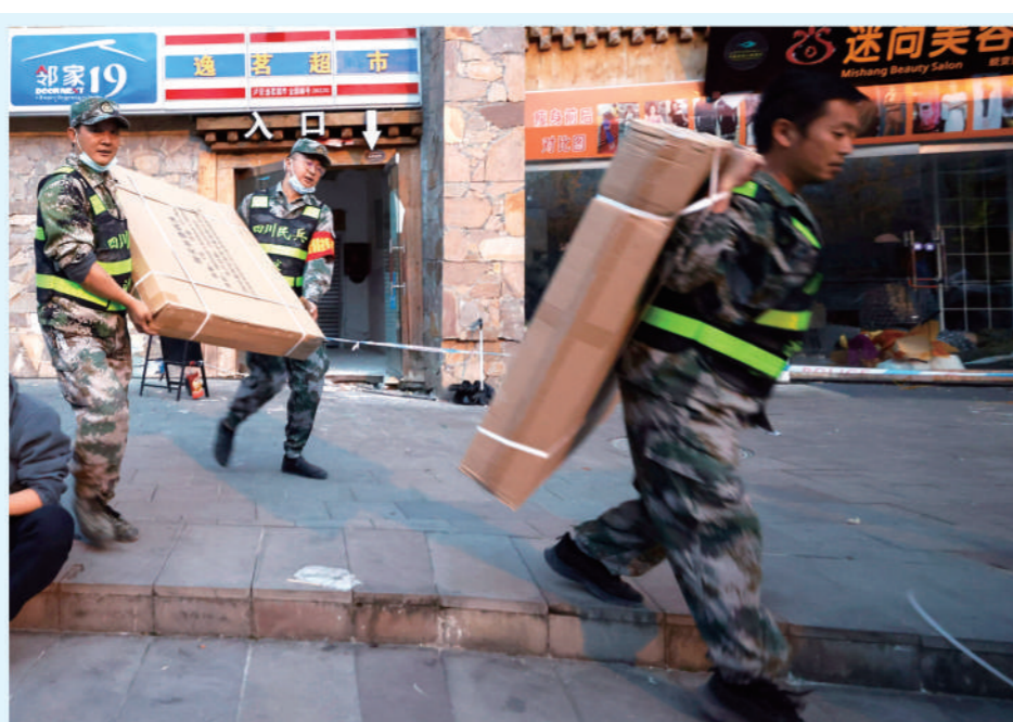
四川甘孜州泸定县磨西镇,救援人员正在搬运物资