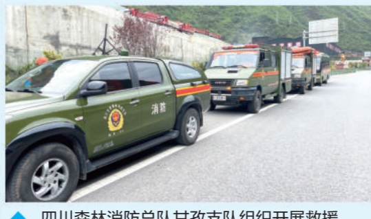
四川森林消防总队甘孜支队组织开展救援