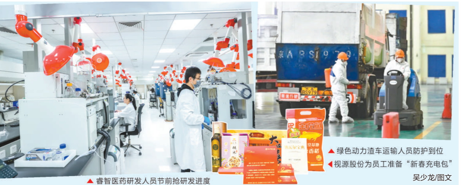
▲睿智医药研发人员节前抢研发进度