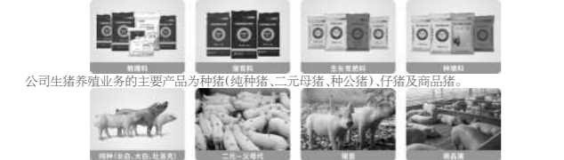
公司生猪养殖业务的主要品种为种猪(母猪、二元母猪、种公猪)、仔猪及商品猪。

2. 报告期内主要业务经营高增长 (一) 饲料业务 (二) 生猪养殖业务 (三) 其他业务